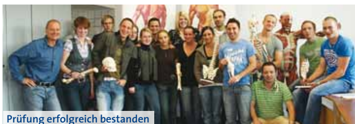
Prüfung erfolgreich bestanden

Ebenfalls im September erfolgten die Prüfungen der Massageschüler. Diese insgesamt zweijährige Ausbildung schließt ebenfalls mit einem staatlichen Examen ab. Von den 19 Teilnehmern absolvierten 16 erfolgreich ihre Prüfungen.