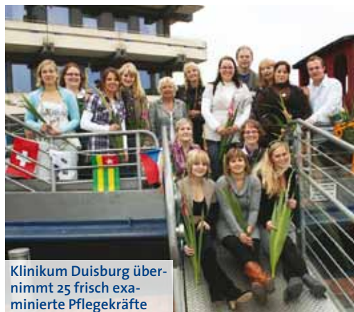
Klinikum Duisburg übernimmt 25 frisch examinierte Pflegekräfte

Es war der dritte Abschlusskurs nach der neuen integrativen Ausbildung. In den ersten beiden Jahren ist der Unterricht für die Gesundheits- und Krankenpfleger sowie für die Gesundheits- und Kinderkrankenpfleger gleich, erst im dritten Jahr erfolgt die Spezialisierung. Die neue Ausbildungsstruktur eröffnet den jungen Leuten verbesserte Chancen auf dem Arbeitsmarkt, da ihre Einsatzmöglichkeiten breiter gefächert sind.