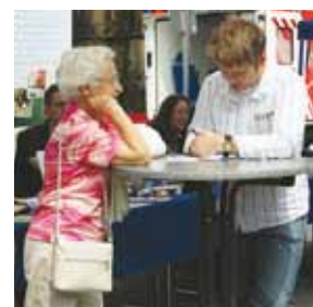
Auch ein Demenz-Test wurde angeboten

Mehr als 300 Besucher nutzten das Angebot, ihren Blutzucker, Blutdruck sowie den Anteil des Körperfettes messen zu lassen. Außerdem konnten die Besucher der Messe am späten Nachmittag einer Gruppe bei ihren Taiwan-Do-Übungen zusehen.