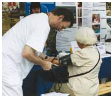
Besucher konnten sich ihren Blutdruck messen lassen

Das Klinikum Duisburg war im Juni dieses Jahres auf der „Großen Kommunalen Gesundheitskonferenz“, die auf dem Burgplatz in Duisburg stattfand, vertreten. Besucher hatten die Möglichkeit, sich über Gesundheitsangebote des Klinikums zu informieren, unter anderem auch über das Gesundheitsprogramm „Klinikum Vital“. Zudem boten Mitarbeiterinnen und Mitarbeiter des Klinikums Tests rund um die Themen Demenz, Sturzprävention sowie Schlaganfall an.