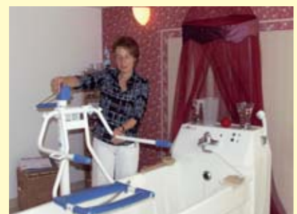
Demonstration der Benutzung einer Einstiegshilfe

Für das leibliche Wohl der Gäste wurde mit Frühstücksbuffett, Mittagessen sowie Kaffee und Kuchen ebenfalls ausreichend gesorgt.