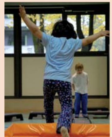
Spielerisch das Gleichgewicht finden