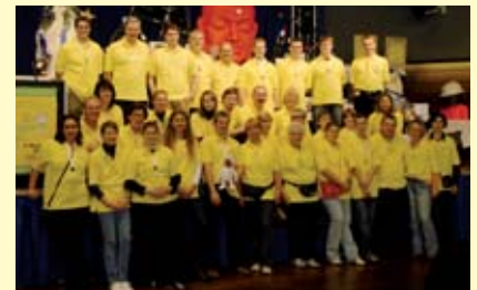
Mitglieder des Gänseblümchen e.V.

Am 2. November 2008 fand in der Stadthalle Ratingen eine große Benefiz-Veranstaltung des Vereins Gänseblümchen e.V. statt. Der Verein unterstützt krebskranke Kinder und deren Familien. Er organisiert Ausflüge für die Kinder mit deren Eltern und Geschwistern. Viele Besucher kamen und unterstützten diese Aktion. Mit dem erzielten Gewinn können nun im kommenden Jahr wieder viele Ausflüge und eventuell erforderliche Hilfsmittel finanziert werden. Ausführliche Infos über den Verein finden Sie unter www.gaensebluemchen-nrw.de