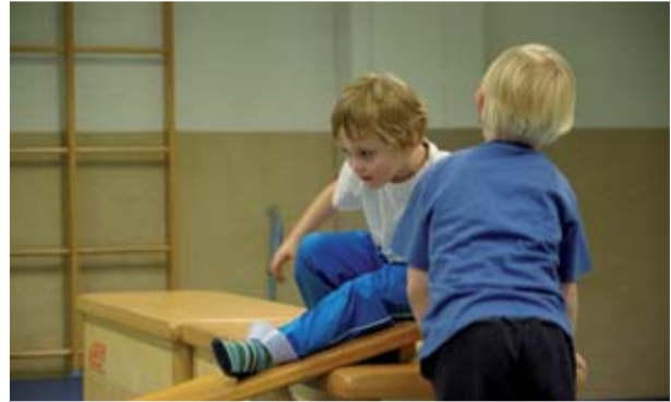
Gemeinsam Höhen erklimmen