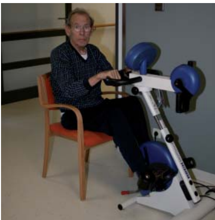
Sportliche Betätigung hält fit!

Im November 2007 wurde die Station C36 senioren- und behindertengerecht umgebaut und diente somit als Pilotprojekt der Klinik für Geriatrie. Diese neue Station fand großen Anklang bei den Patienten und dem Personal und war Anlass für die Realisierung des Umzuges.