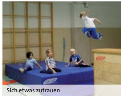
Sich etwas zutrauen

Besonders empfehlenswert ist sie jedoch für Kinder, auf die eine der nachfolgenden Beschreibungen zutrifft: